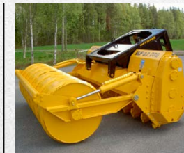
POMALUBĚŽNÉ LESNÍ FÉRZY SUOKONE