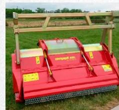
RYCHLOBĚŽNÉ LESNÍ FRÉZY SEMI M.