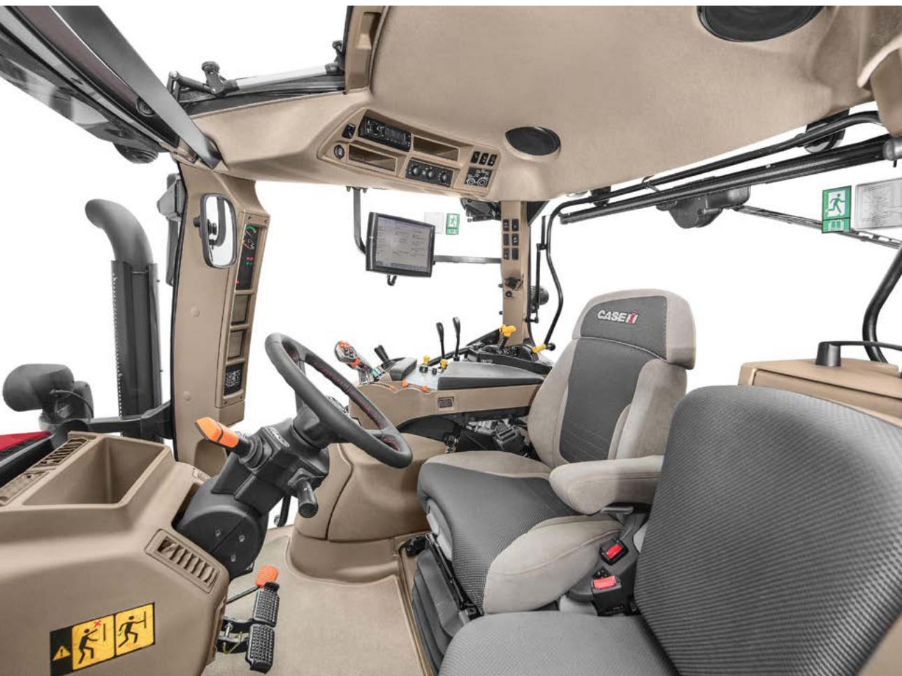
Loketní opěrka Multicontroller

Vstupte na palubu a užijte si maximální komfort.